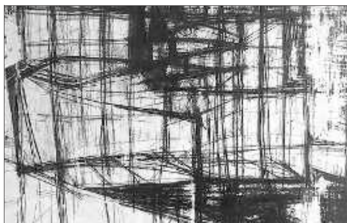
Castillo de Paja de Helmut Waldschmitt.

Heures d'ouverture : le mercredi de 14 h à 17 h, le samedi et le dimanche de 14 h à 19 h.