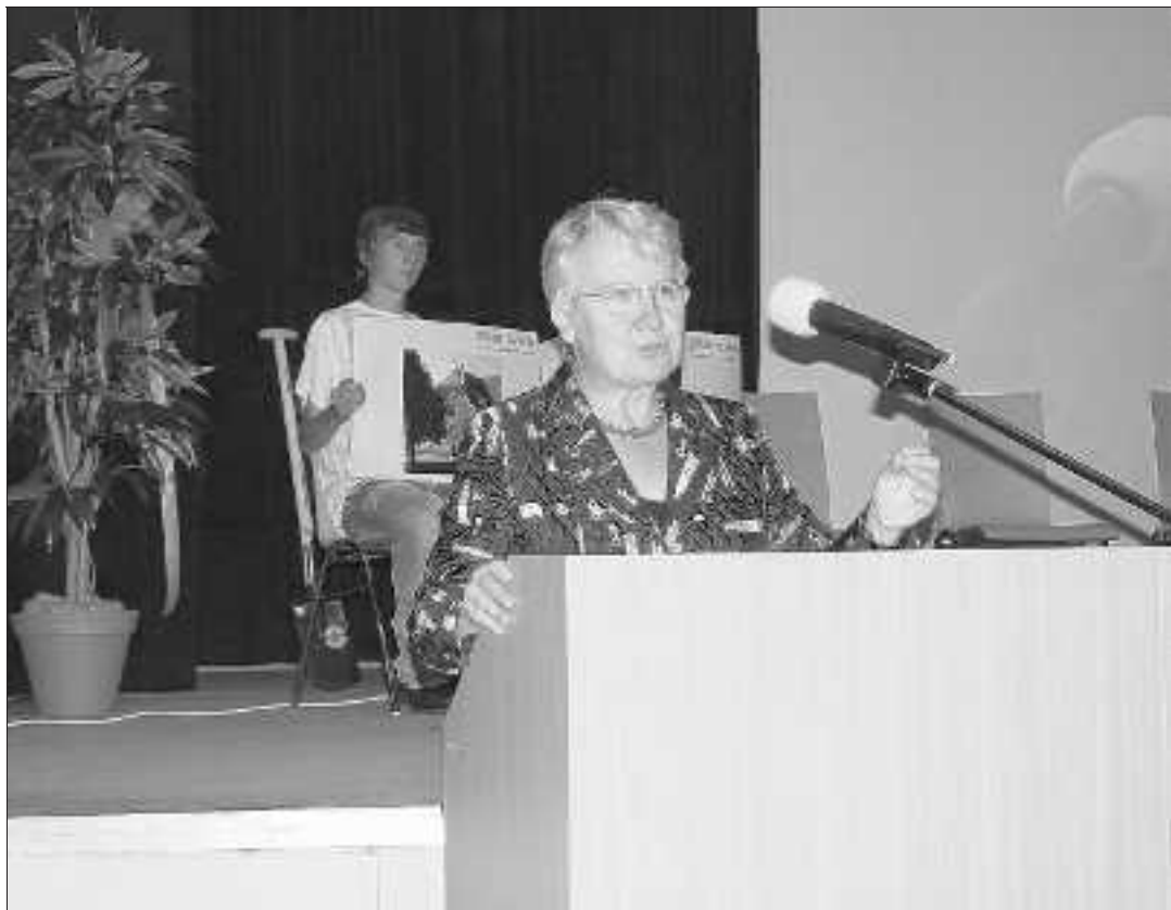
Annette Schavan lors de la cérémonie qui a accompagné la pose de la première pierre.

Le centre, situé sur le Schulcampus Rosenfels, accueille les jeunes l'après-midi, après les cours,