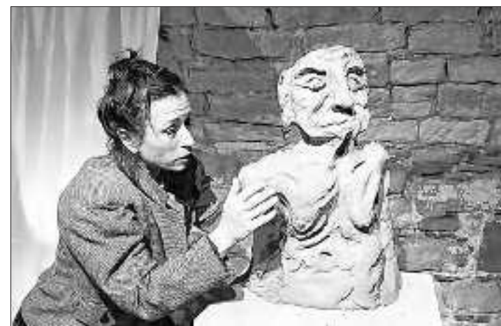
La vie d'une grande artiste.